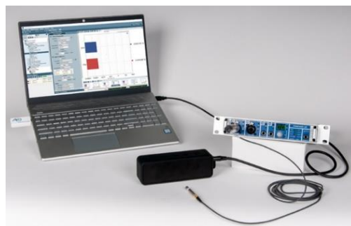
RME Fireface UC との組み合わせ例